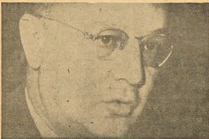
Prof. Nihad Erim Genel Başkanlığa doğru