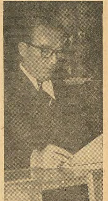
Prof. Turhan Feyzioğlu Demirel ile yarış!