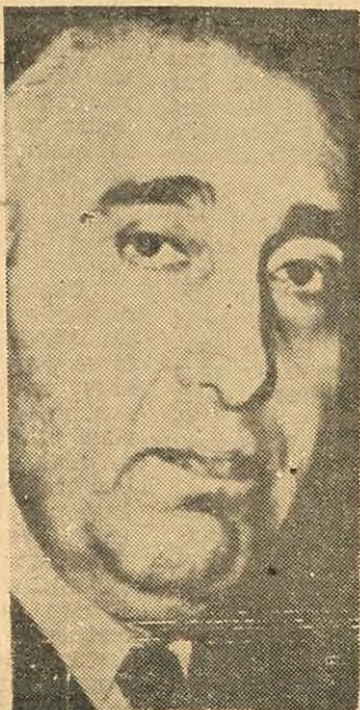
Salâh El Bitar

Komünist Partisi tercihini, daha Baas Partisinin Suriye kolu iktidarın tamamını tekeli altına almadan önce, 1965 Ocak ayında yapmıştır. Baas'ın Araplara rast Merkez Örgütünün de tasvibiyle girilen geniş çaptaki millileştirme hareketleri üzerine, Halit Bekdaş, Prag'dan hükümete bir tebrik telgrafı göndermiştir. Millileştirmeler üzerine çarşının giriştiği grevi kırmak için asırı sol militanlar sokağa inmishlerdir. Bu millileştirme tedbirleri, Baas Partisi sinesinde 1963 Martı darbesinden beri, «ılımlılar» ve «aşırılar» arasında için için süren mücadelenin so-