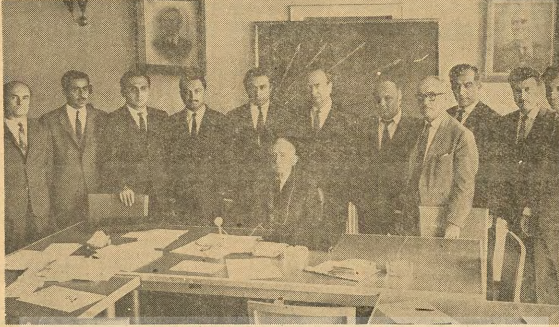
CHP'nin yeni Merkez Yönetim Kurulu Ortanın solu ekibi